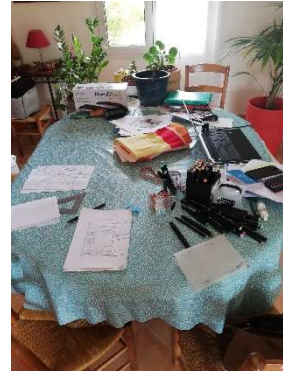
(Mes différents bureaux d'appoint dans le logement familial)